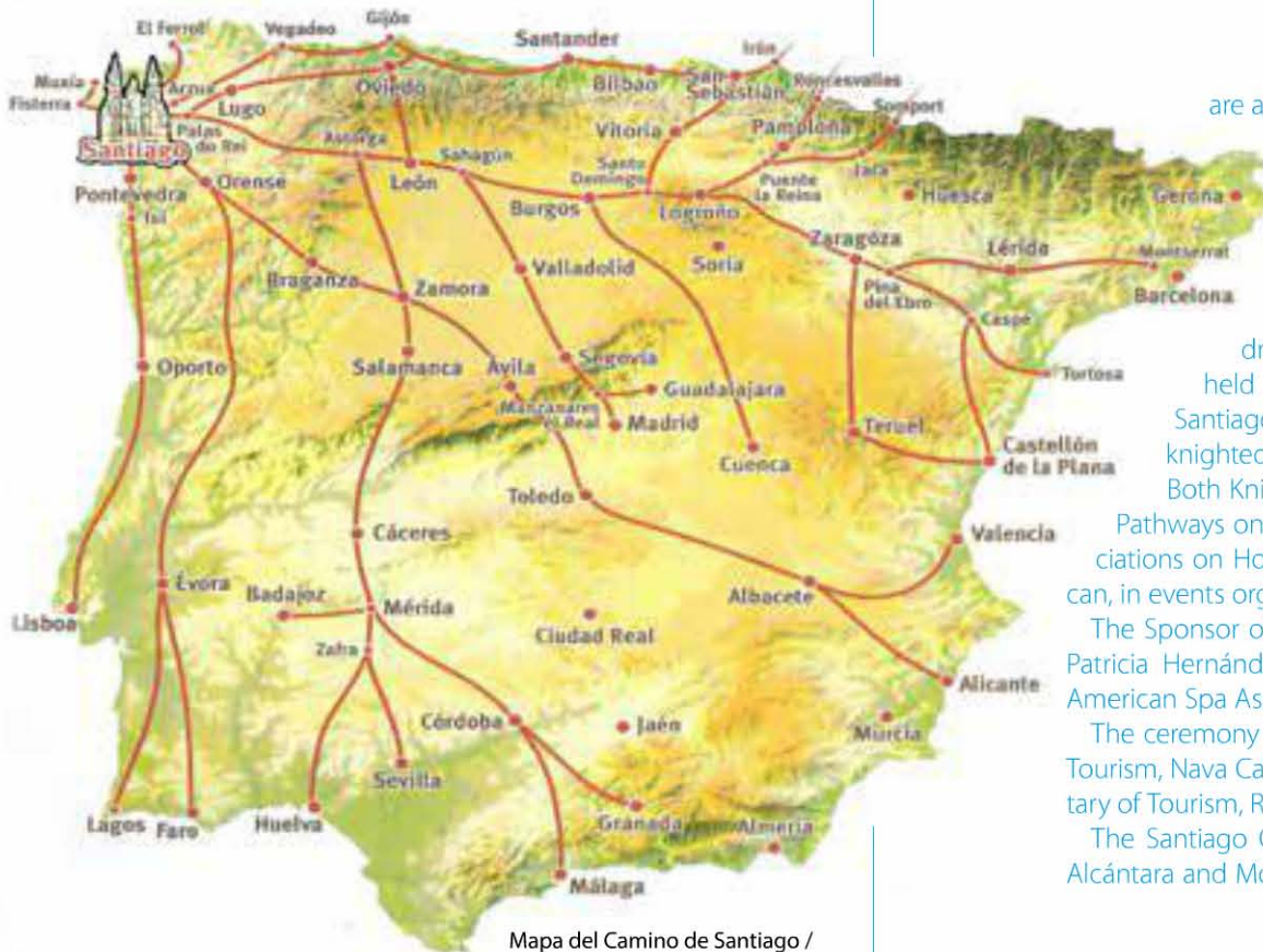
Mapa del Camino de Santiago / Santiago pathways road map.