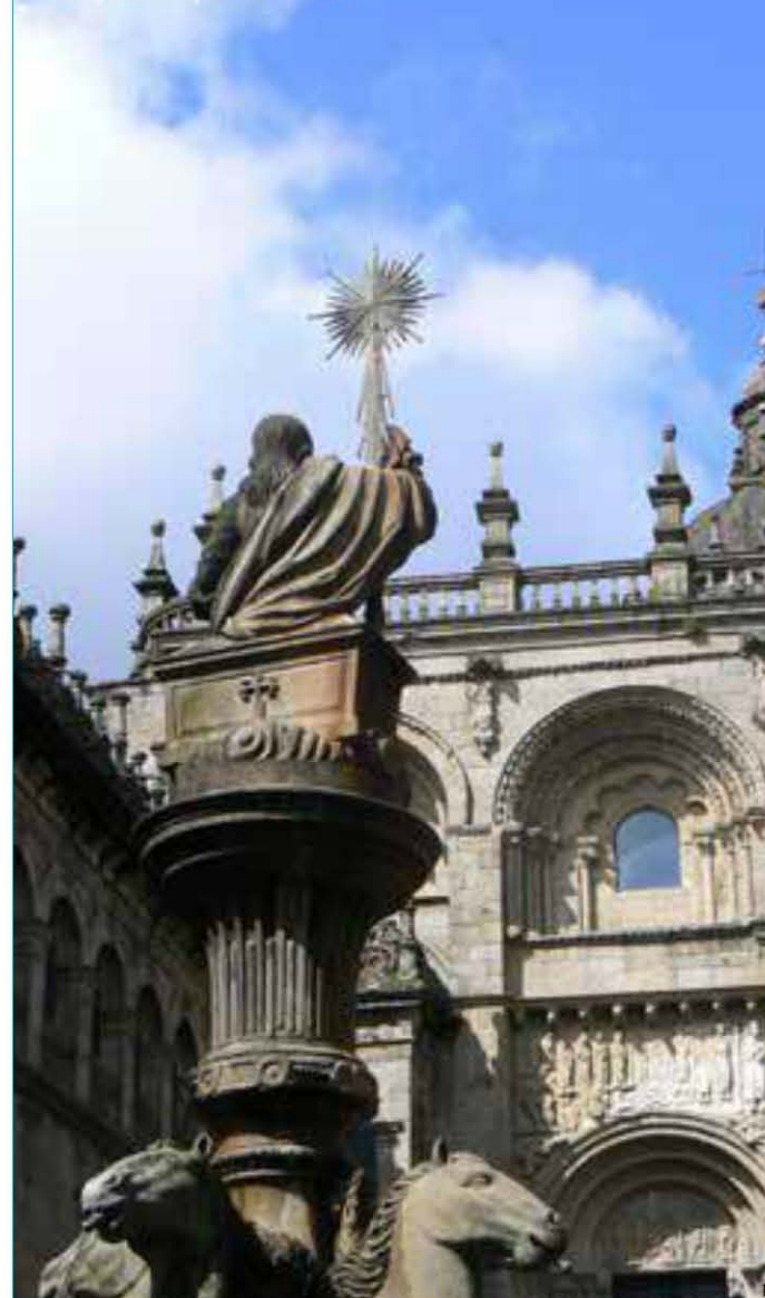
Catedral de Santiago de Compostela / Santiago de Compostela Cathedral

En Santiago del Estero, Argentina, coincidiendo con el día de San Francisco de Asís y en la iglesia del mismo nombre, se celebró en capítulo extraordinario la investidura de once nue-